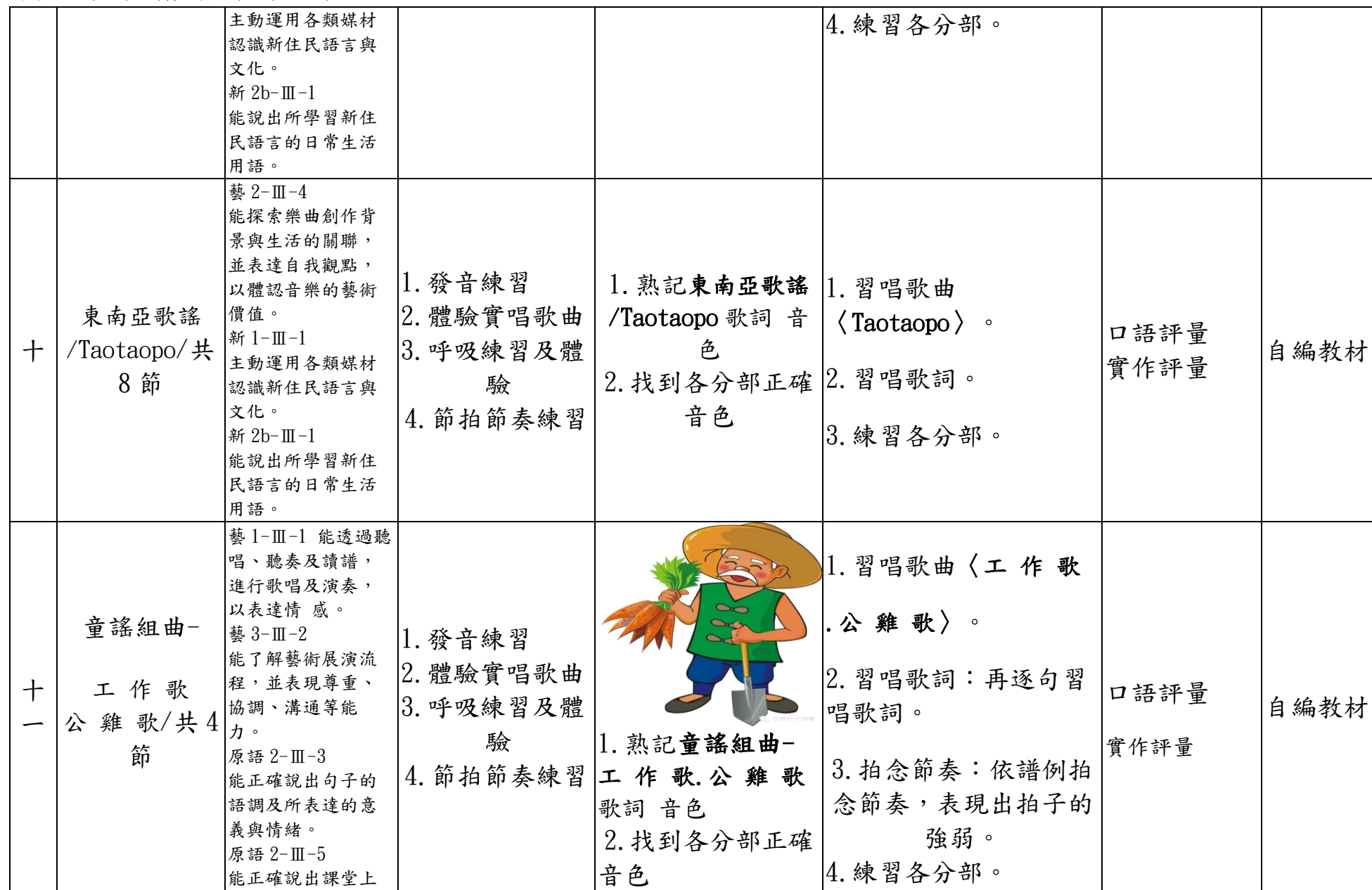
附件 3-3 (九年一貫/十二年國教並用)