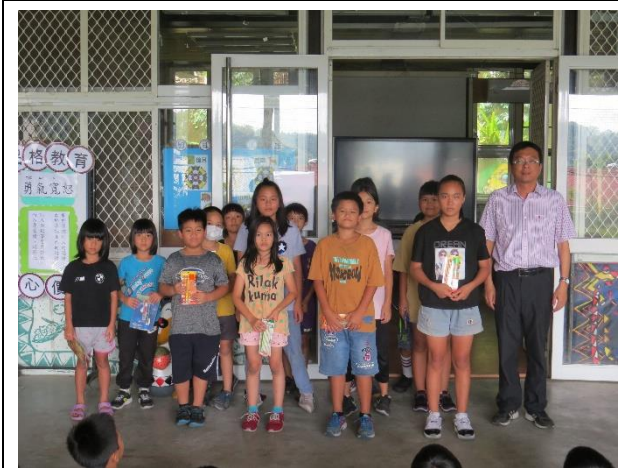
活動名稱：每月閱讀心得寫作頒獎