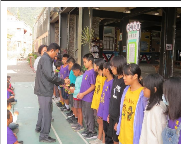
活動名稱：閱讀護照認證頒獎