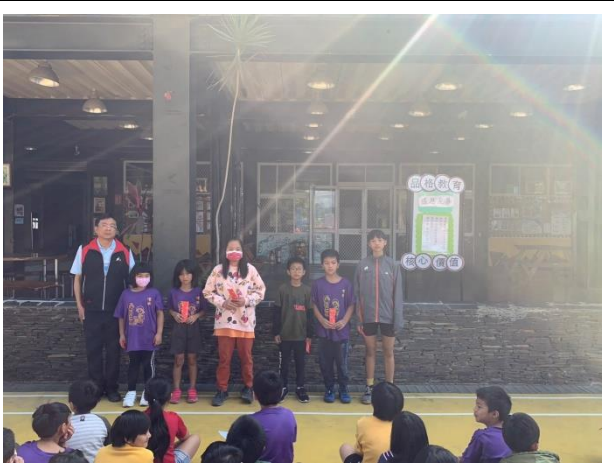
活動名稱：每月閱讀心得寫作頒獎