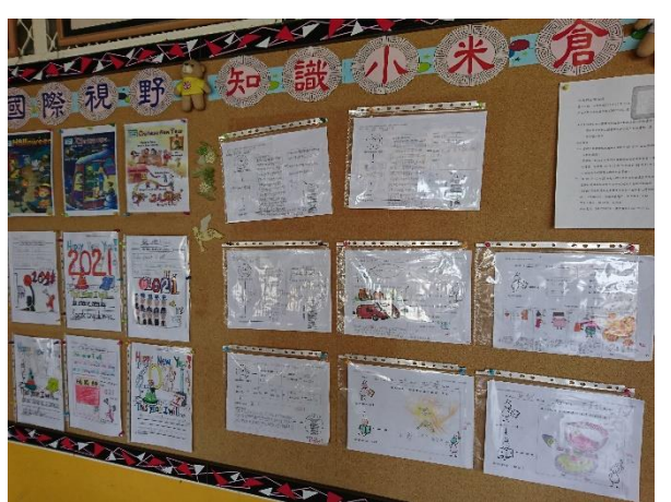
活動名稱：每月閱讀心得優秀作品