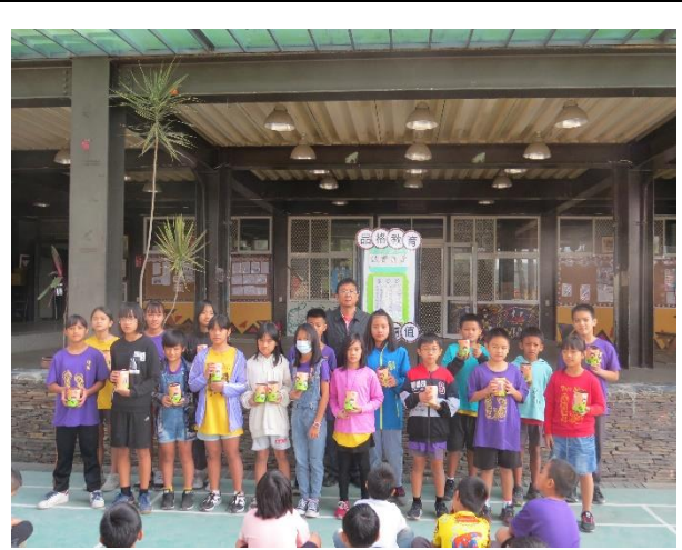
活動名稱：閱讀護照認證頒獎