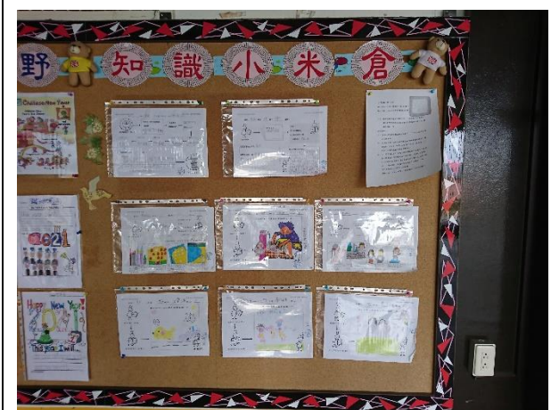
活動名稱：每月閱讀心得優秀作品