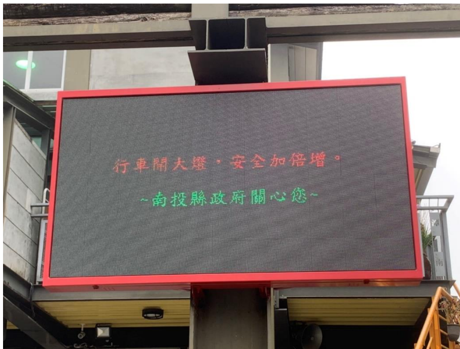
說明：校門口 LED 宣導行車開大燈，安全加倍增