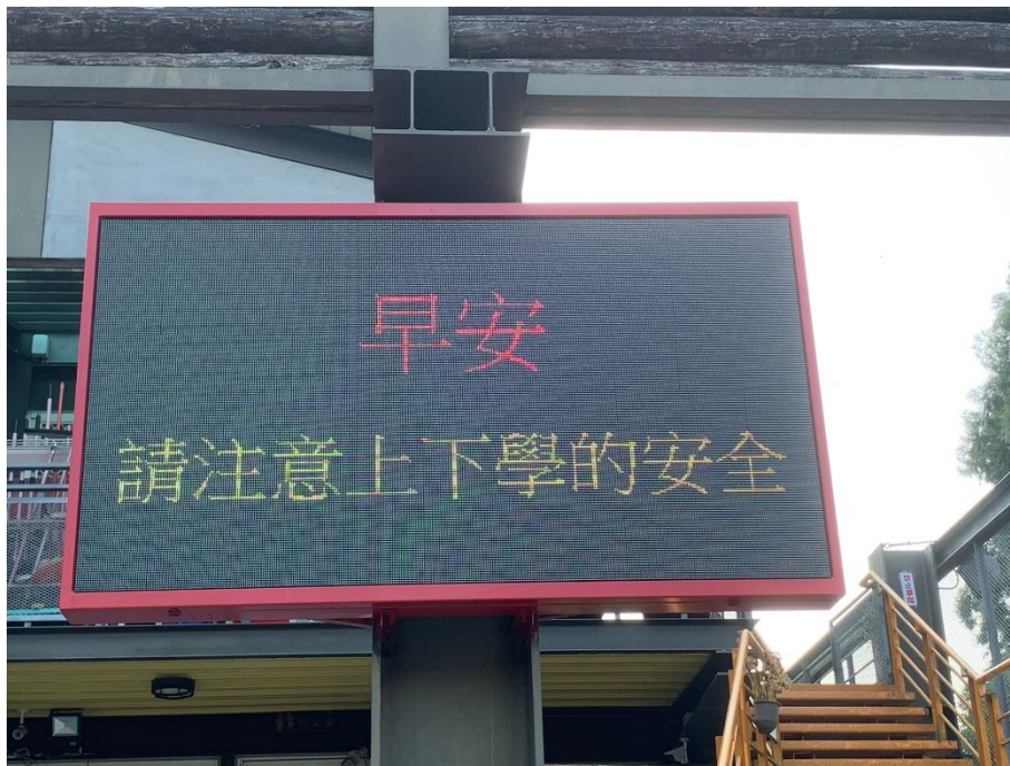
說明：校門口 LED 宣導注意上下學安全