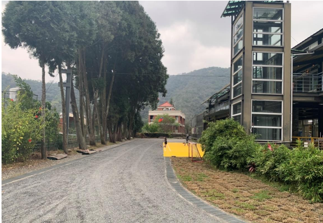
說明：校園另一側為學生活動區，保持場地空曠。