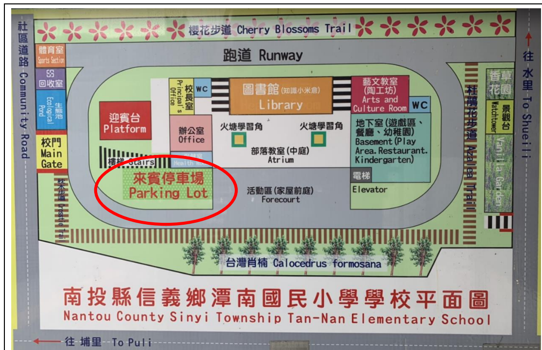
說明：校園平面圖及停車位置圖