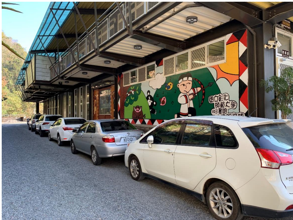
說明：校內教師汽車停放區，整齊排放不影響行人走動